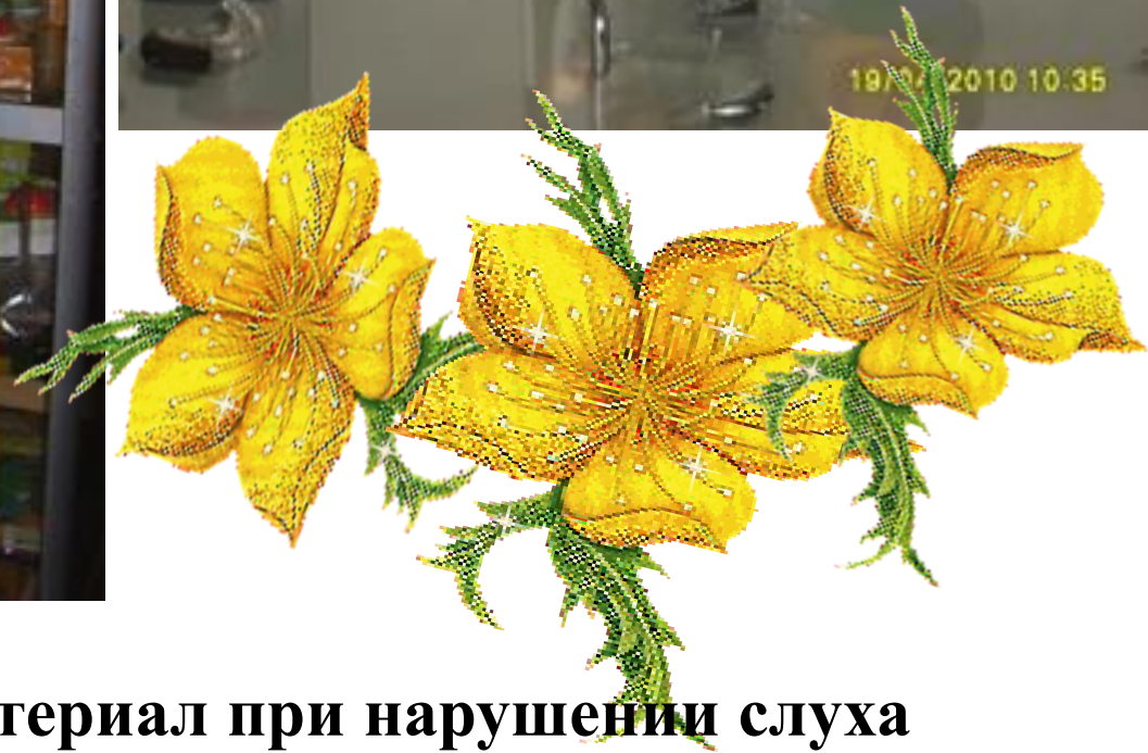
Диагностический материал при нарушении слуха