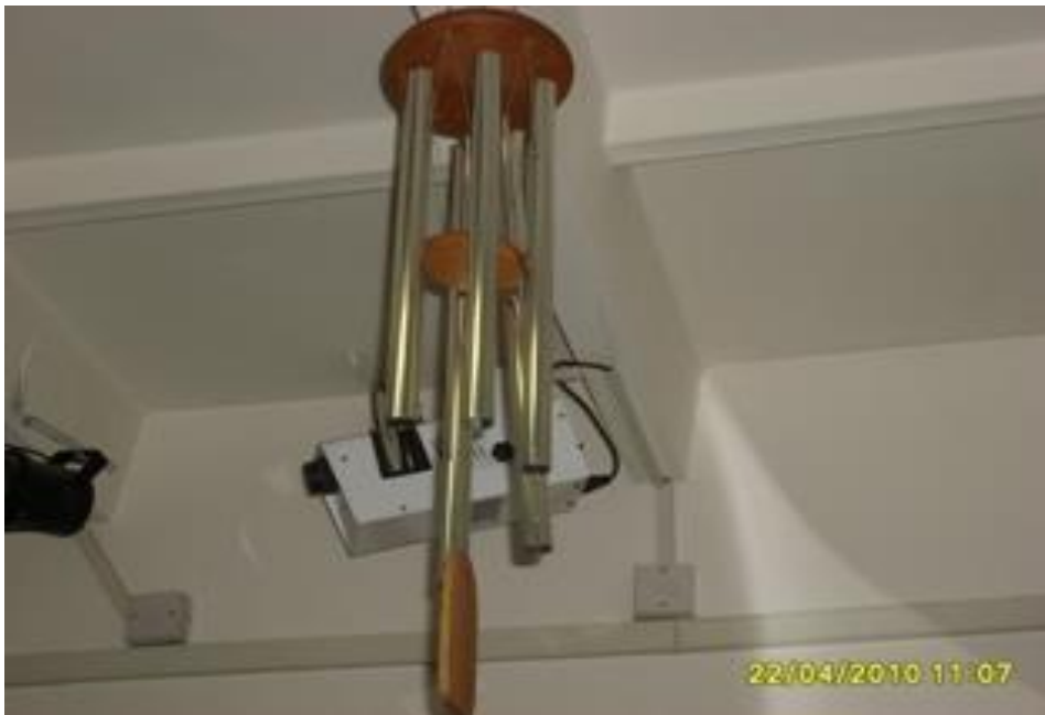
Мабайл по Феншую и видеопроектор