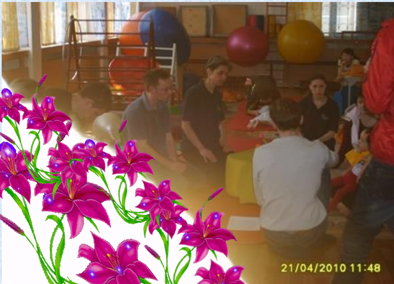
Волонтеры из Германии проводят обучающий тренинг для сотрудников центра